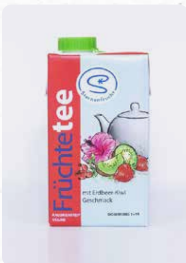
Früchtetee-Erdbeer-Kiwi Art.-Nr. 14325