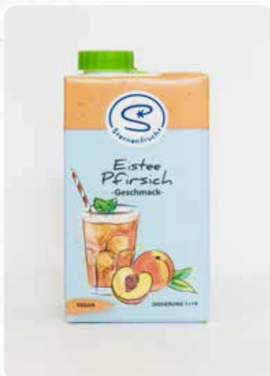
Eistee Pfirsich Art.-Nr. 14312