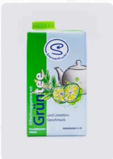
Grüntee-Limette Art.-Nr. 14323