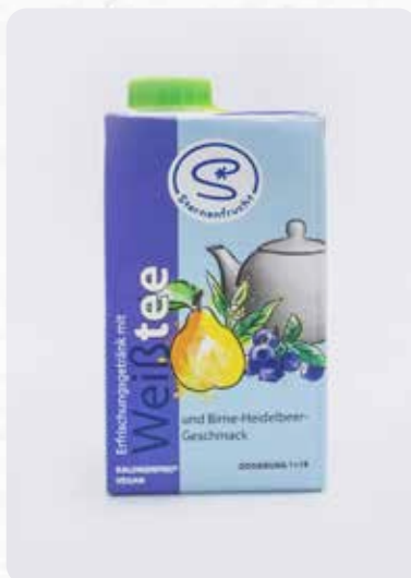
Weißtee-Birne-Heidelbeere Art.-Nr. 14321