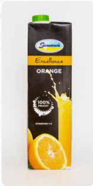
Orange Art.-Nr. 14601