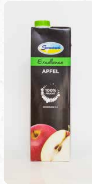
Apfel Art.-Nr. 14603