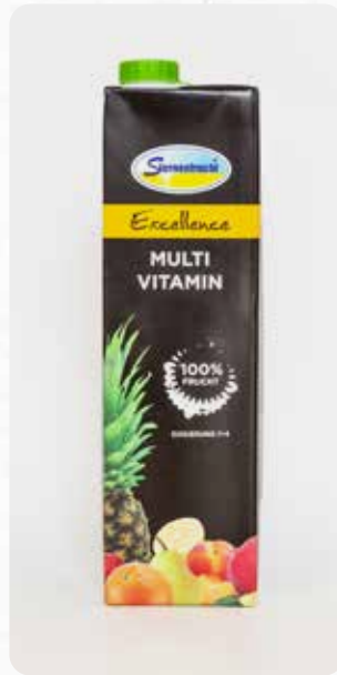
Multivitamin Art.-Nr. 14602